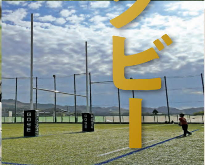
▲御所実業ラグビー部が主催する「御所ラグビーふえすた」に参加した子どもたち

ラグビーワールドカップが日本で開催され盛り上がった2019年。そして、東京オリンピックでも7人制ラグビーが競技種目となり、ますます盛り上がりを見せています。