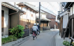
五條市・新町 重要伝統的建造物群保存地区

間走行できま(せん)など、交通ルールとマナーを順守して、サイクリングを楽しみましょう。