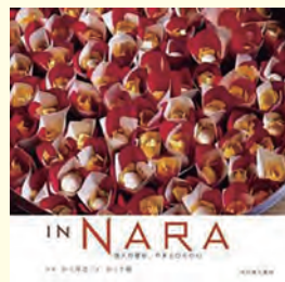
IN NARA 悠久の歴史、やまとびとの心 井上博道 写真 井上千鶴 文(光村推古書院)

奈良を愛し、撮り続けた写真家・井上博道氏。古都の伝統行事や神社仏閣、里山の風景など、彼の心に映った美しい光景が詰まったたくさんさんの写真に妻の千鶴氏が文を添えた素晴らしい写真集が出版された。文書はすべて和英対訳で、海外の方に奈良を紹介する際にも重宝だ。