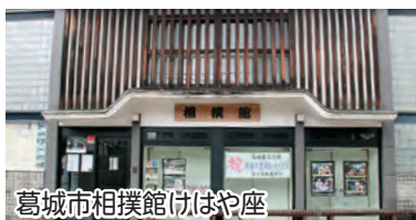
葛城市相撲館けはや座