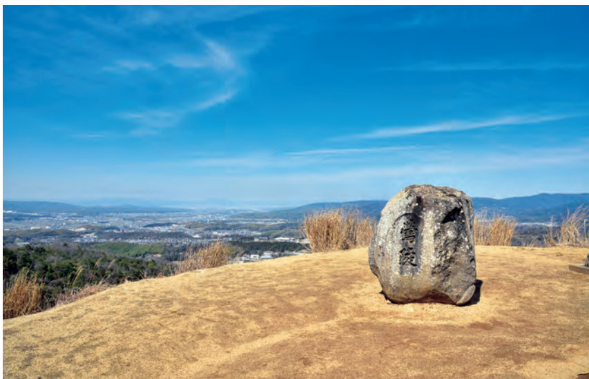
写真② 若草山の鶯塚

——読者諸賢、当然ながら現在は、古墳・史跡を許可なく掘削することは認められていません。