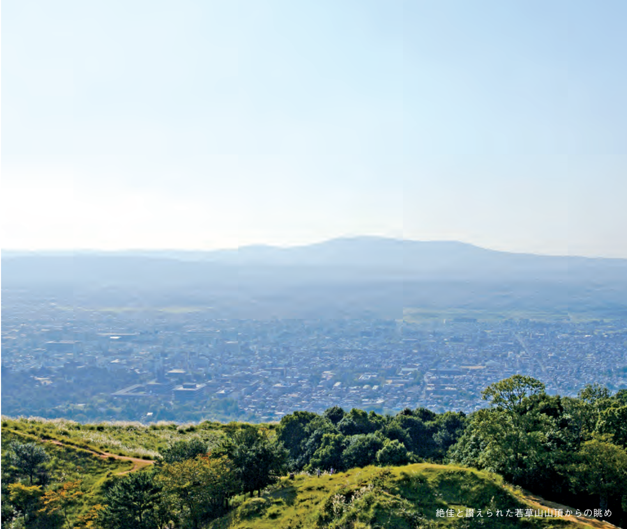
絶佳と讃えられた若草山山頂からの眺め