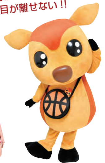
チームキャラクター 「シカッチェ」