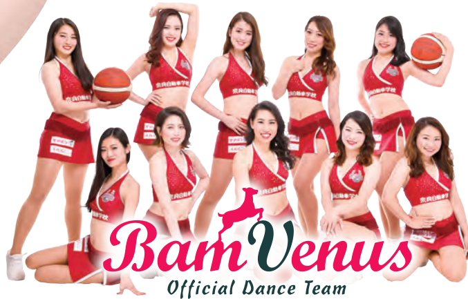
オフィシャルダンスチーム「バンビナス」