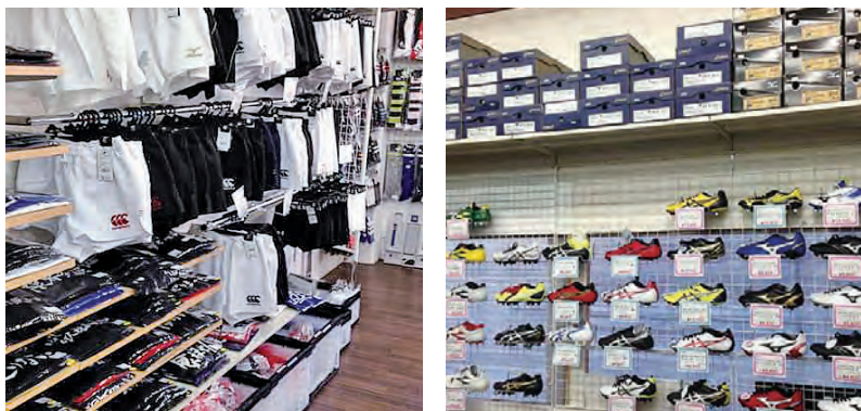
園児からトップリーガーまで来店する品揃え！

ラグビーに必要なスパイク、ジャージ、ヘッドキャップ、ショルダーガードなどをまとめた新入生セットも販売。ラグーマンデビューにおすすです。