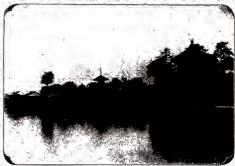
写真① 田山花袋「寧楽の古都」

その山続きの鶯塚といふ石の下に友が曾遊の時、後日の記念のためにとて小さい一箇の洋刀を埋めて置いたから、それを若し興があつたなら掘つて見給へ。十年前の錆び洋刀をさがし当など妙ではないかといふ事であつた。