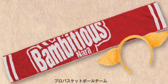
プロバスケットボールチーム バンビシャス奈良 応援グッズ (マフラー・タオル・シカツ・フェカチューシャ)