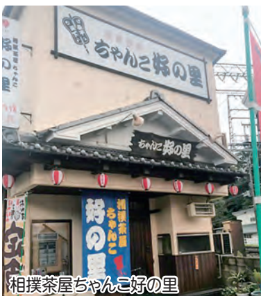
相撲茶屋ちゃんこ好の里