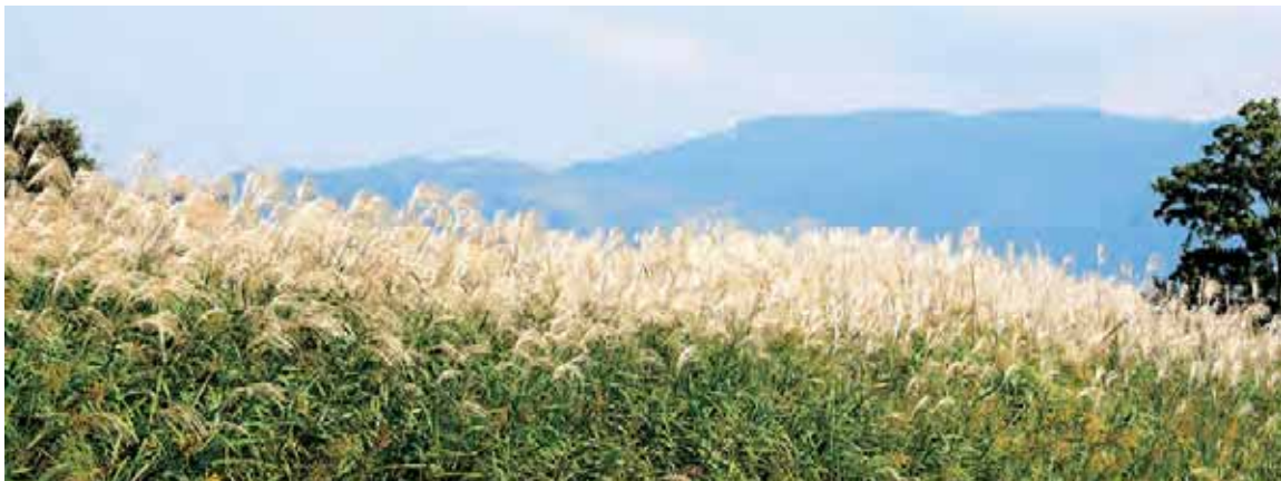
平城宮跡 背の高いオギの白銀色の穂は宮跡の秋を際立たせます。秋風に揺れてこすれ合うと、秋祭りの囃子を想像してしまいます。

季節限定の彩りを眺め、もの思いにふけたり、明日のことを考えたり、あるいは思考を空っぽにしたり。今年の秋冬も、奈良でいい風景を見つけてください。