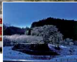
又兵衛桜 宇陀市にある推定樹齢300年のシダレザクラ。“氷の花”の数か月後、桜色の絶景が見られます。