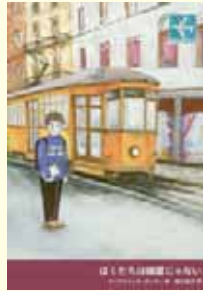
ぼくたちは幽霊じゃない ファブリツィオ・ガッティ 作 関口英子 訳(岩波書店)

ウィキとその家族は生きていくために、愛する故郷を捨て、隣国に渡った。故郷では望めない平穏な暮らしを夢見て、不法移民となったのだ。 ボートの上での恐ろしい出来事、警察や雇い主の仕打ち、泥地でのバラック生活…風貌が、言葉が、文化が違う。異国の壁は高く、神の家である教会す