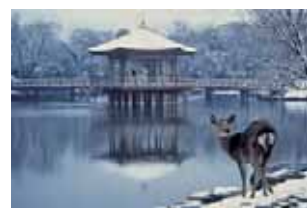
浮見堂 奈良公園にある鶯池に浮かんでいるかのように建つ六角堂。銀世界になれば、鹿も見とれます。