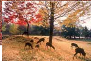
奈良公園 子どもから高齢者まで全世代が気軽に足を運べる国名勝の公園。秋が深まると、イチョウの絨毯と鹿たちが絵になります。