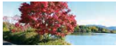
水上池 平城宮跡の北にある溜め池。約1.5kmある周回路の北側と西側でカエデが紅色に染まります。