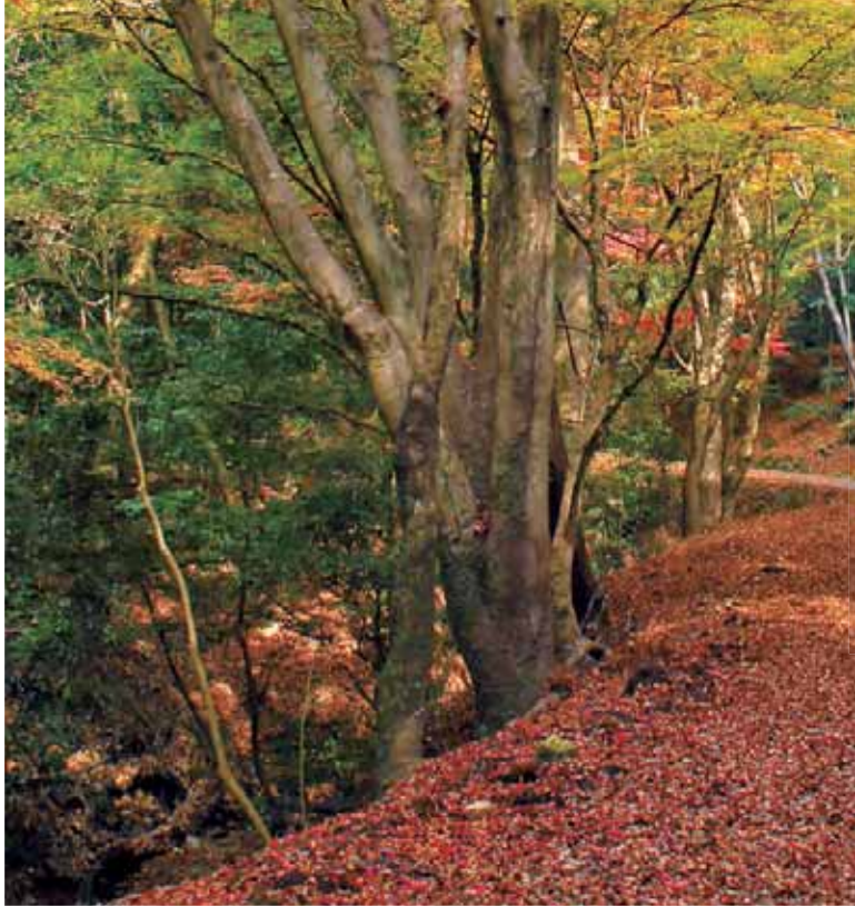
春日奥山遊歩道 春日山原始林を周遊できるハイキングコースです。紅葉、黄葉、常緑樹などが織りなす“錦絵”の世界に浸れます。

県内各地の神社仏閣で紅葉を鑑賞するのもヨシですが、秋は他の季節より自然に近づきたくなりま す。それは彩りのせいでしょうか、 下がり始めた気温のせいでしょうか。 か。特に今年の秋は、人出で賑わ うスポットではなく、錦絵のよう な自然風景を求めて、「静かに、ゆっ たり、脱人ごみ」がお出かけのキー ワードになりそうです。