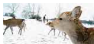
飛火野 雪が積もった朝。鹿たちが普段より人懐っこいように思えます。