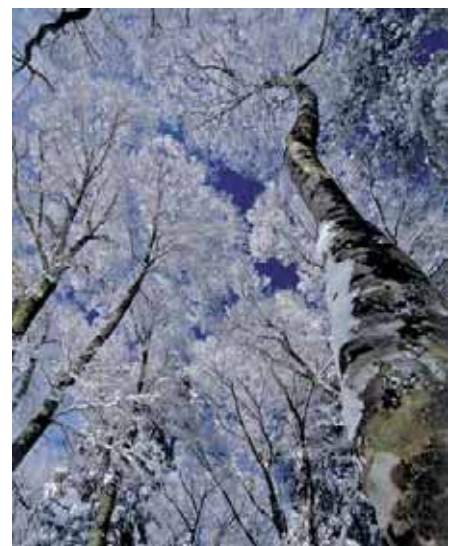
金剛山 御所市と大阪府千早赤阪村の境にそびえる標高1125mの山。厳冬期は樹氷が見られます。

奈良の行事や観光スポット、グルメ情報などを発信する「NARABURA」(ならぶら)でも、おすすめの秋冬風景を紹介しています。