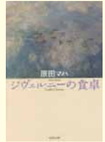
ジヴェルニーの食卓 原田マハ 著(集英社文庫)

美しい絵画は画家の類まれなる才能によってのみ生み出されるわけではない。本書はマティス、ドガ、セザンヌ、モネなど有名な画家の身近な女性の視線から語られている。戦争や社会情勢経済的に支援してくれるパトロンや画商との関係だけではなく、画家仲間や家族との温かなやりとりが生きてきたと描かれている。世の中になかなか認められない苦悩や葛藤と、作品に対する