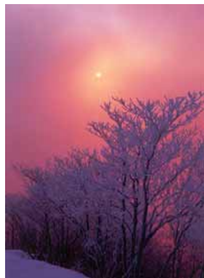
高見山 標高1249m。三角錐形の山容は「近畿のmatterホルン」とも。朝日に照らされる樹氷が見事です。東吉野村に登山口があります。