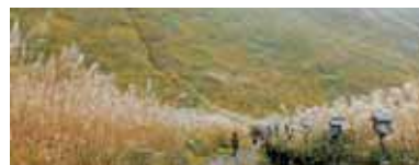
曾爾高原 さわさわと揺れる一面のススキの穂は奈良を代表する秋の風物詩です。