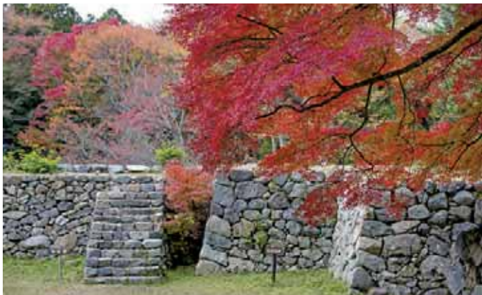
高取城跡 日本屈指の山城の跡。二の丸石垣などの遺構と四季の彩りが見ものです。