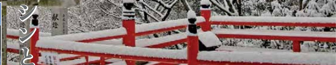
信貴山朝護孫子寺 聖徳太子の戦勝祈願を叶えた毘沙門天がご本尊。雪をかぶった福虎の向こうに本堂が行みます。