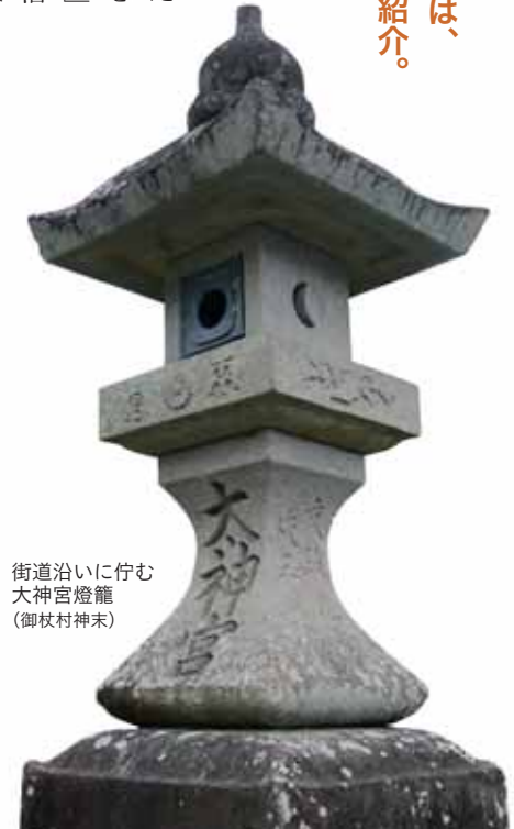
街道沿いに佇む大神宮燈籠 (御杖村神末)