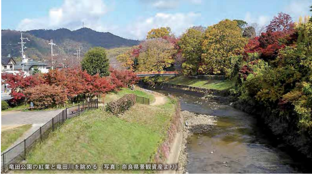
竜田公園の紅葉と竜田川を眺める

少年が活躍するアニメの、劇場版の題名にも使われましたね。業平詠では、紅葉の紅色が川面に映る姿を、くくり染めに見立て、能因詠では、風に舞い、水面に落ちた紅葉を、豪華な錦に喩えたものとなっています。両首とも、紅葉の華麗さを見事に表現しています。