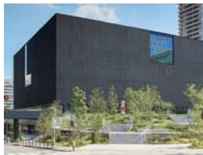
黒いキューブ型の外観はこれまでの美術館像を覆す斬新なデザイン。中之島全体のバランスも考慮して設計されている。

大阪府大阪市北区中之島4-3-1 TEL:06-6479-0550 2022年2月2日オープン予定