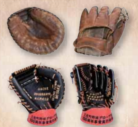
三宅町野球グローブ生産100周年