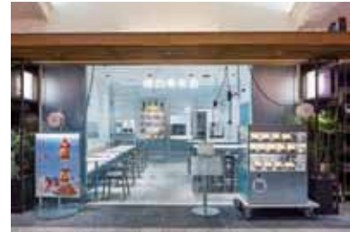
店外のショーケースとメニューの写真がとても食欲をそそります。

オープンしました。渋谷にも堀内果実園の店舗がありますが、カフェスタイルの店舗は東京ではソラマチ店だけ。フルーツもスイーツも好きだ!という方に早くも人気が定着。奈良発のフルーツカフェがおいしいビタミンを届けています。