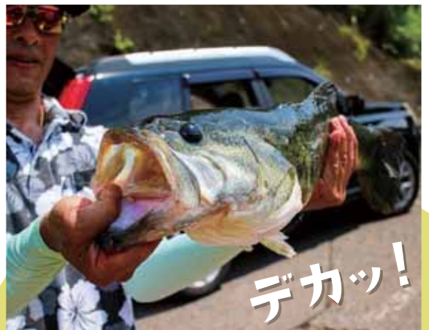
取材時に釣り上げられた60センチのモンスターバス。連日大型のバスが釣りあげられSNSなどで報告されている。上北山村、下北山村には民宿やキャンプ場など宿泊施設が充実しているので、全国からアングラーが絶えず訪れています。

ブラックバスはルアー(疑似餌)で釣るのが最も楽しめるでしょう。沢山の種類の中からルアーを選びます。水面を逃げる魚のように泳がせたり、キラキラ光るルアーで小魚が暴れているように演出したり、音や臭いの付いたルアーもあります。また釣る場所も重要です。その時の気候や水温・水質などを考え、どこに魚がいるか戦略を立てます。自分が思い描いた場所・ルアーで釣れた時の感動は計り知れないでしょう。特に大型になると引きの強さは想像を超えます。