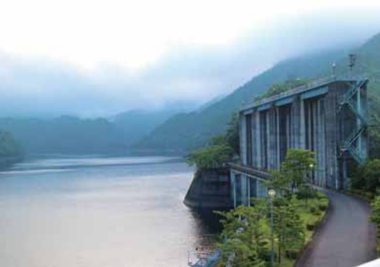
池原ダムは1964年に完成した高さ110メートルのアーチ式ダムとして国内最大総貯水容量と湛水面積を誇る。2005年にはダム湖百選にも選ばれている。