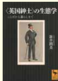
〈英国紳士〉の生態学 ことばから暮らしまで 新井潤美 著(講談社)

英国は「階級」の社会だという。階級が違えば言葉も作法も変わる。紅茶にミルクを入れる際の後先まで変わるというのだから恐れ入る。上流階級と労働者階級の間に位置する中流階級(ミドル・クラス)は内部で更に細分化されており、その内情は日本人には何とも難解なのだ。上流階級同様に「紳士