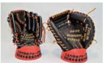
2020年、奈良県高等学校夏季野球大会、夏季奈良県高等学校軟式野球大会の出場校に寄贈されたグローブとミット。