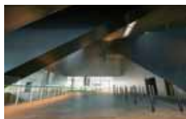
内部は複雑な吹き抜け構造。館内は5階建てとなっており、1~2階はさまざまな人が自由に行き来することが想定されている。