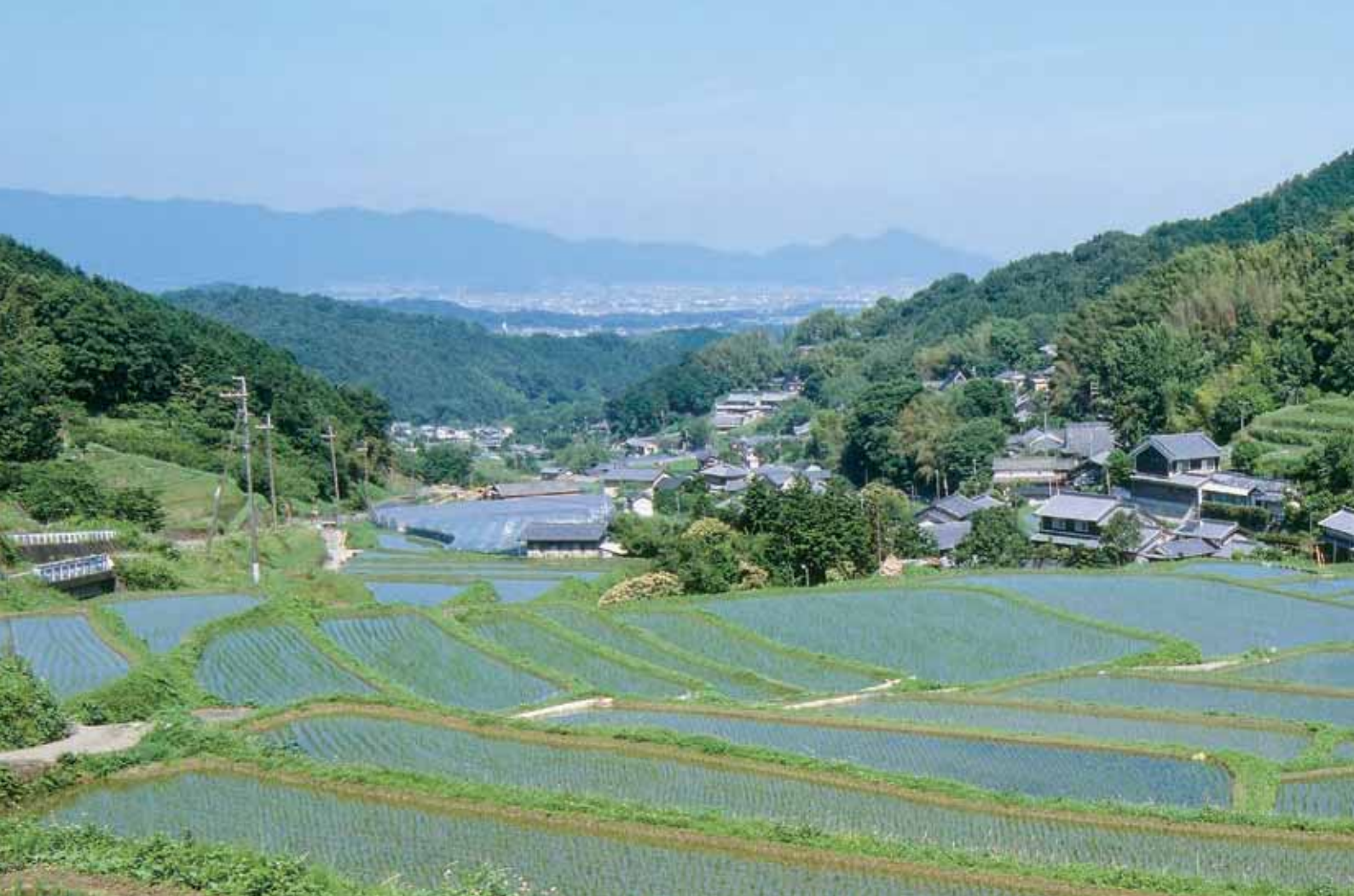
明日香村の棚田風景