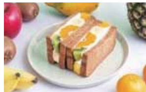
店員さんのオススメがこちらのフルーツサンドです。

オープンしました。渋谷にも堀内果実園の店舗がありますが、カフェスタイルの店舗は東京ではソラマチ店だけ。フルーツもスイーツも好きだ!という方に早くも人気が定着。奈良発のフルーツカフェがおいしいビタミンを届けています。