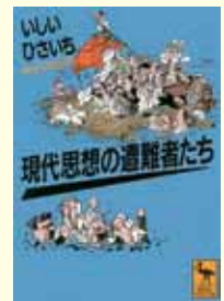
現代思想の遭難者たち いしいひさいち 著(講談社)

学生時代に哲学を学びたいと考えたことがあった。その際、書店で哲学の入門書を購入したが、その内容でさえ難解で理解するのは無理だった。有名だし読んでいたらカッコいいかな、という不純な理由でニーチェなんかも手に取ってはみたが、何を書いているのかさっぱりであきらめた。 それからだいぶ年月は経過したが時々、哲学に再度挑戦したいという欲求が起る。そんな折、仕事中商品