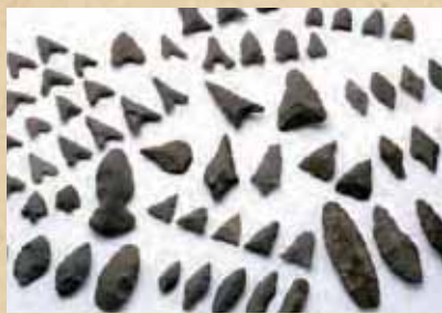
竹内遺跡出土の石器 二上山はサヌカイトの産地でもあり、昔は田畑でも石器が見つかったといわれています