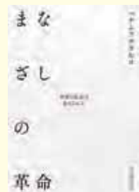
まなざしの革命 世界の見方は変えられる ハナムラチカヒコ 著(河出書房新社)

「コロナのパンデミックによって、この2年間で大きく社会が変化した。今後の先行きが見えない、そもそも原因となるウイルス自体が目に見えない。気に掛けず過ぎる事はない」という考えも当然と言える。ただ不安だと言っぱかりで自分で何か調べた事はあるのか、メディアやSNSを通じて流れてくる色々な情報を鵜呑みにして