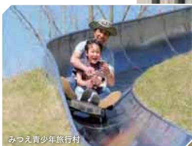
みつえ青少年旅行村