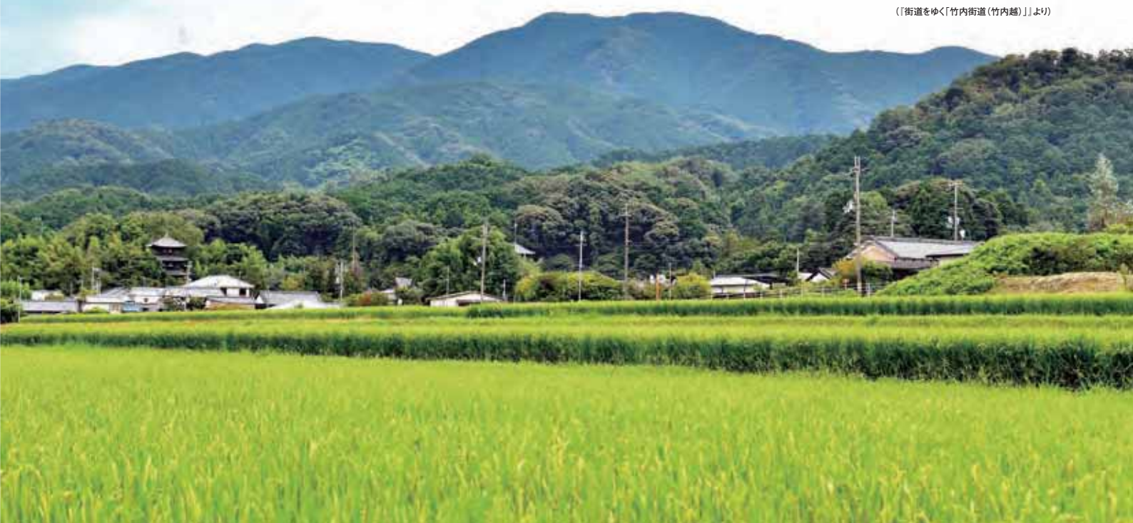
樹叢にうずもれてかすかにうかがえる當麻寺と、青田越しの葛城山系