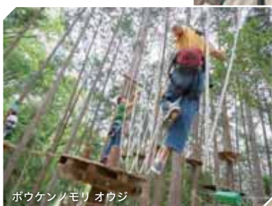
ポウケンノモリ オウジ