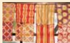
古典柄や花柄のなど数多くの模様があり、昔の人は棒切れや板切れだけで工夫しながら様々な模様を作っていたことがわかります。