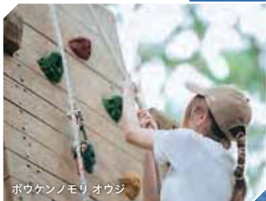
ポウケンノモリ オウジ