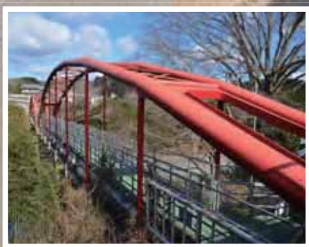
紀の川水管橋（和歌山県橋本市）からの眺望。写真左奥から落合川が注ぎ、吉野川が紀の川と名を変える。