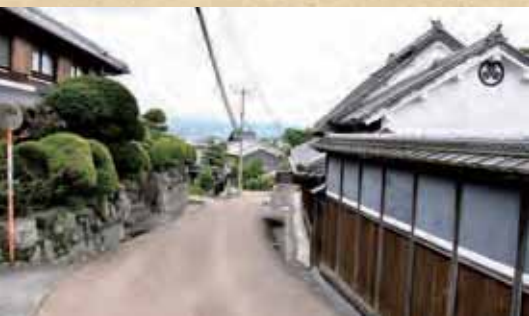
司馬さんが「葛城乙女」とすれ違った場所…かもしれない竹内街道の坂道（葛城市内）周辺には駐車場も整備されています