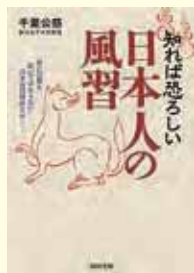
知れば恐ろしい 日本人の風習 千葉公慈 著(河出文庫)

「夜に爪を切ってはいけない」と子供のころ親に言われたことはないだろうか？私もよく親から言われた記憶がある。昔は明かりも乏しいので暗い中で爪を切りすぎてはいけないう程度に考えていた。本書を店頭で見つけ何気なくページをめくり「夜に爪を切る」