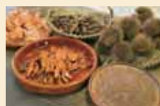
稲(赤米)、クチナシ、スモモなど染料になる植物はたくさん!