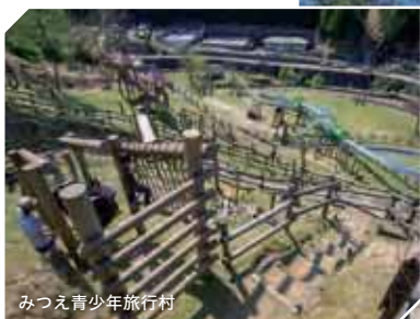
みつえ青少年旅行村