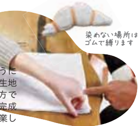
染めない場所は ゴムで縛ります

色が染まりやすいように大豆をしみ込ませた生地を使用します。折り方で模様が決まるので、完成図を想像しながら作業していきます。