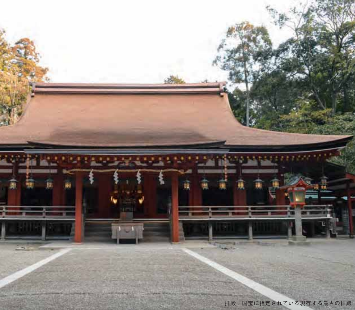
拝殿：国宝に指定されている現存する最古の拝殿