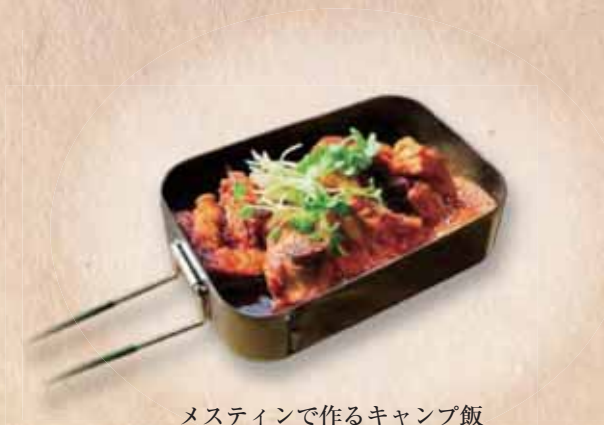
メスティンで作るキャンプ飯