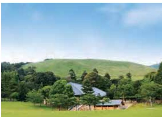
春日野園地からの眺め

奈良公園の東側に位置する若草山。それを聞いて、思い浮かぶ色、それが若草色です。江戸時代の図会などで若草山という言葉が明記されていますが、色名がつけられたのは明治時代と言われています。現在でも山の西麓が芝生で覆われているため、4～5月頃からその名の通り若草色に染められます。