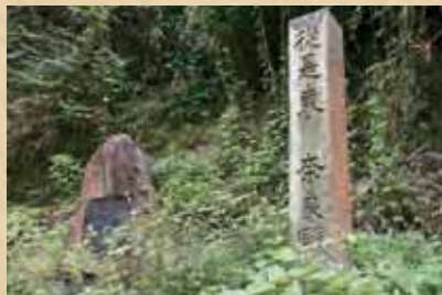
司馬遼太郎揮毫の鶯の関址文学碑と道標