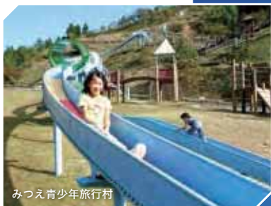
みつえ青少年旅行村