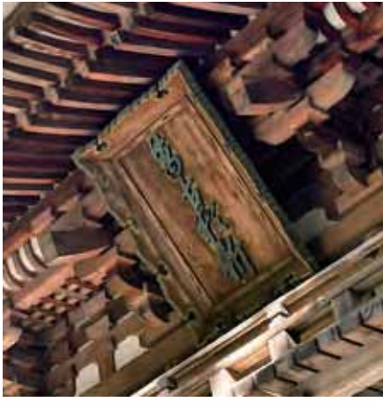
石上神宮楼門「萬古猶新」