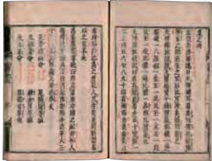
先代旧事本紀 (江戸時代寛永21年版：国会図書館)