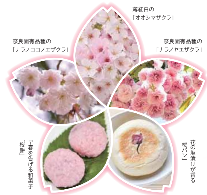
早春を告げる和菓子「桜餅」