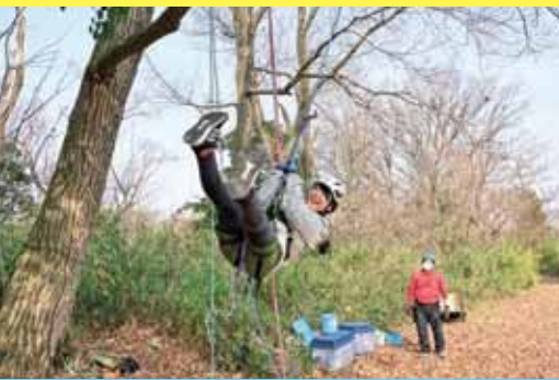
ブランコに早変わり！