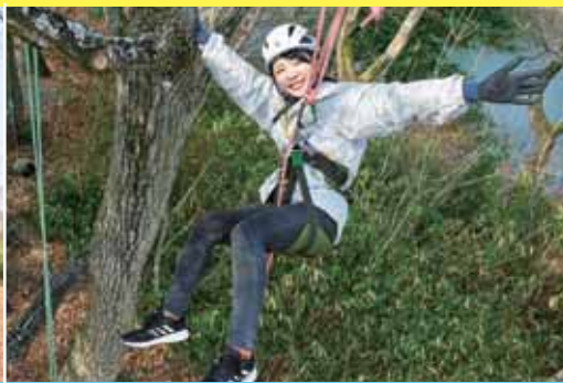
両手を離しても大丈夫！