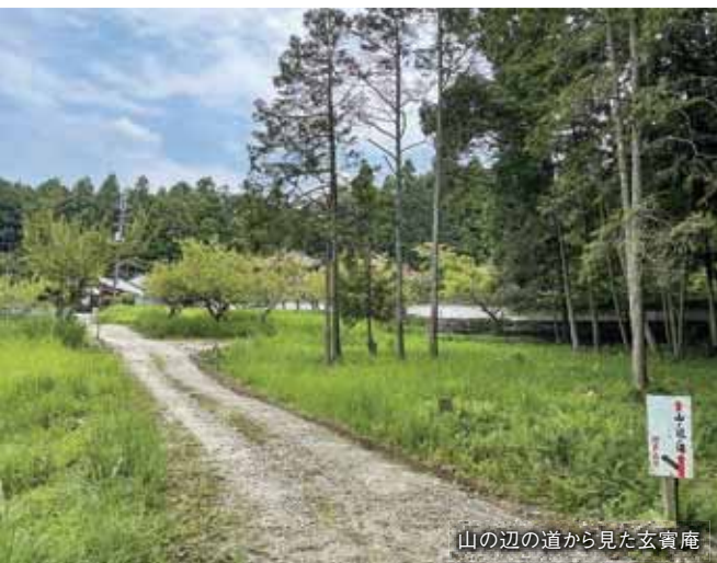
山の辺の道から見た玄賓庵