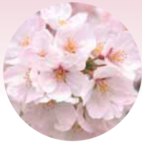
今や桜といえば「ソメイヨシノ」