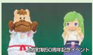
上牧町制50周年記念イベント

上牧町町制50周年のイベントなど町内の行事を中心に活動しています。奈良市で開催される「奈良ちとせ祝ぐ寿ぐまつり」にも参加するなど活動の場を広げています。