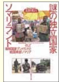
謎の独立国家ソマリランド そして海賊国家プントランドと戦国南部ソマリア 高野秀行 著(集英社文庫)

ソマリランドという国をご存知だろうか。いや正確には国と国連からも認められてはいないので語弊があるが、内戦などで体制が崩壊しているソマリ連邦共和国内に存在する民主主義国家なのだ。ソマリアといえば海賊に対し自衛隊が派遣されたことをニュースで見たくらいの知識しかなかったが、紛争地域であるソマリアのなかに安定した民主主義を築いている場所があるというから驚きだ。それを確かめるべく現地に赴いた著者渾身のルポター