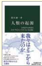
人類の起源 古代DNAが語る ホモ・サピエンスの「大いなる旅」 篠田謙一 著(中公新書)

昔からこの手の話は大好きだ。「人類の起源」なんて興味をそそるフレーズか。ホモ・サピエンスが単独で進化してきたわけではなく、それぞれの時代で複雑に交わりながら、進化し