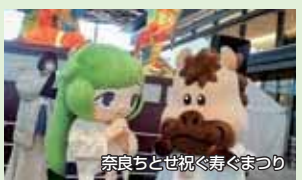
奈良ちとせ祝ぐ寿ぐまつり

【ペ太郎についてのお問い合わせ】 上牧町商工会 住所 北葛城郡上牧町上牧3426-1 電話番号 0745-77-5111