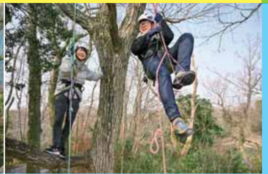
木の上でひと休み！