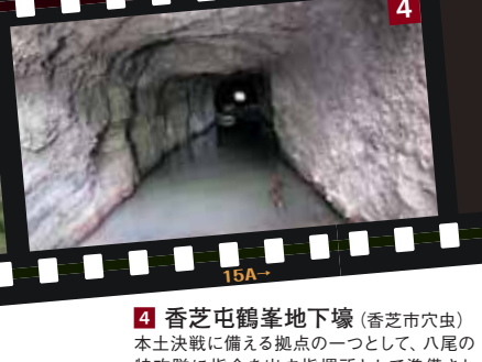
4 香芝屯鶴峯地下壕 (香芝市穴虫) 本土決戦に備える拠点の一つとして、八尾の特攻隊に指令を出す指揮所として準備されたといわれています。